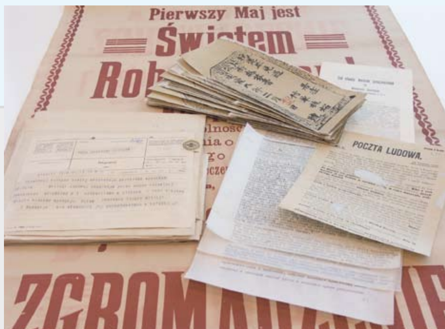
Teiki Regeera po odkwaszeniu i konserwacji zachowawczej w Pracowni Konserwacji i Ochrony Zbiorów Książnicy Cieszyńskiej.